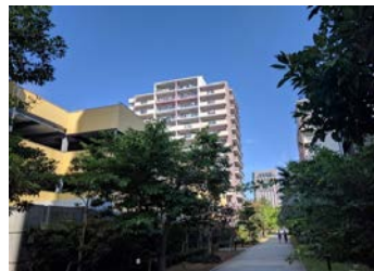
車種を選ばない自走式の駐車場