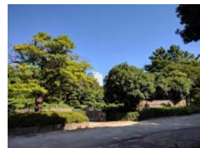
近くの美浜園ではお抹茶もいただけます