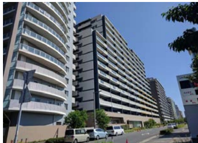
マリンテイストの爽やかな外観